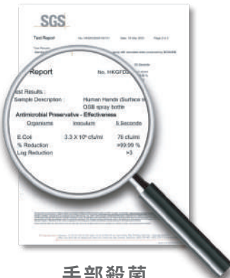
手部殺菌 > 99.99%