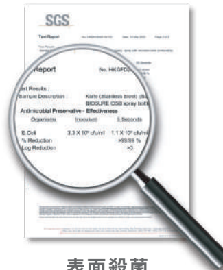
表面殺菌 > 99.99%