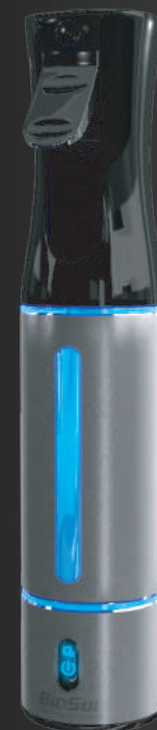
150 ml (0.04 gal)