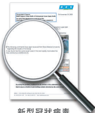
新型冠狀病毒 快速殺滅